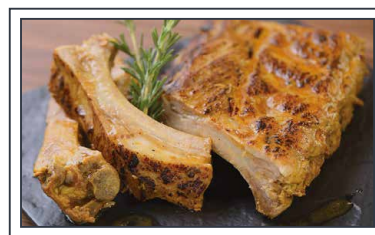
柔らかポークバックリブ 4,000