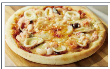
トミーナ監修 海鮮ピザ 3,000