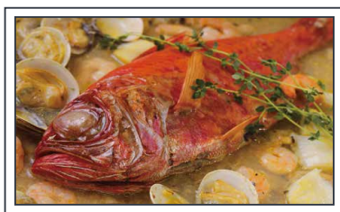
まるごと金目鯛の海鮮アクアパッツァ 5,000