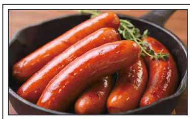
ボリューム満点プレーンソーセージ 1,500